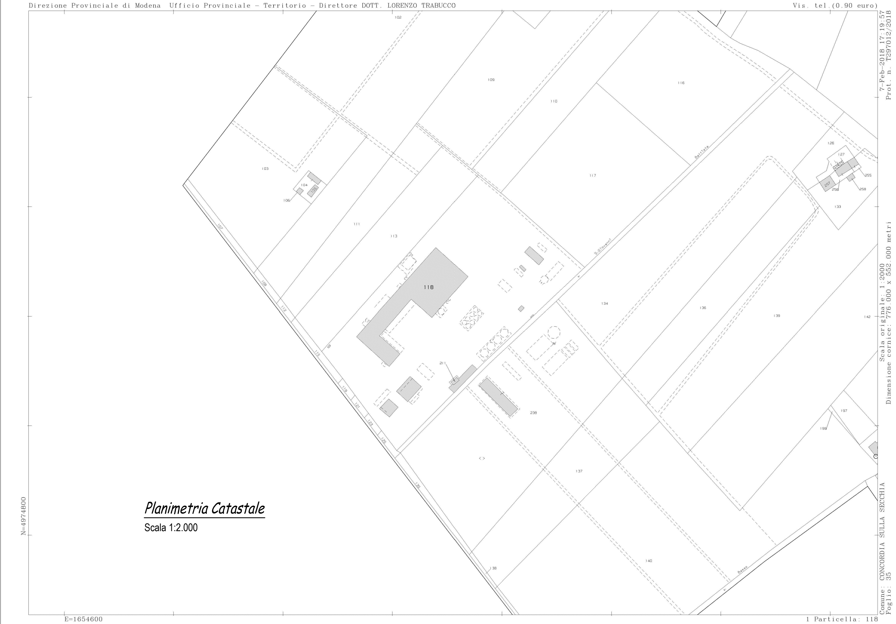
Planimetria Catastale Scala 1:2.000