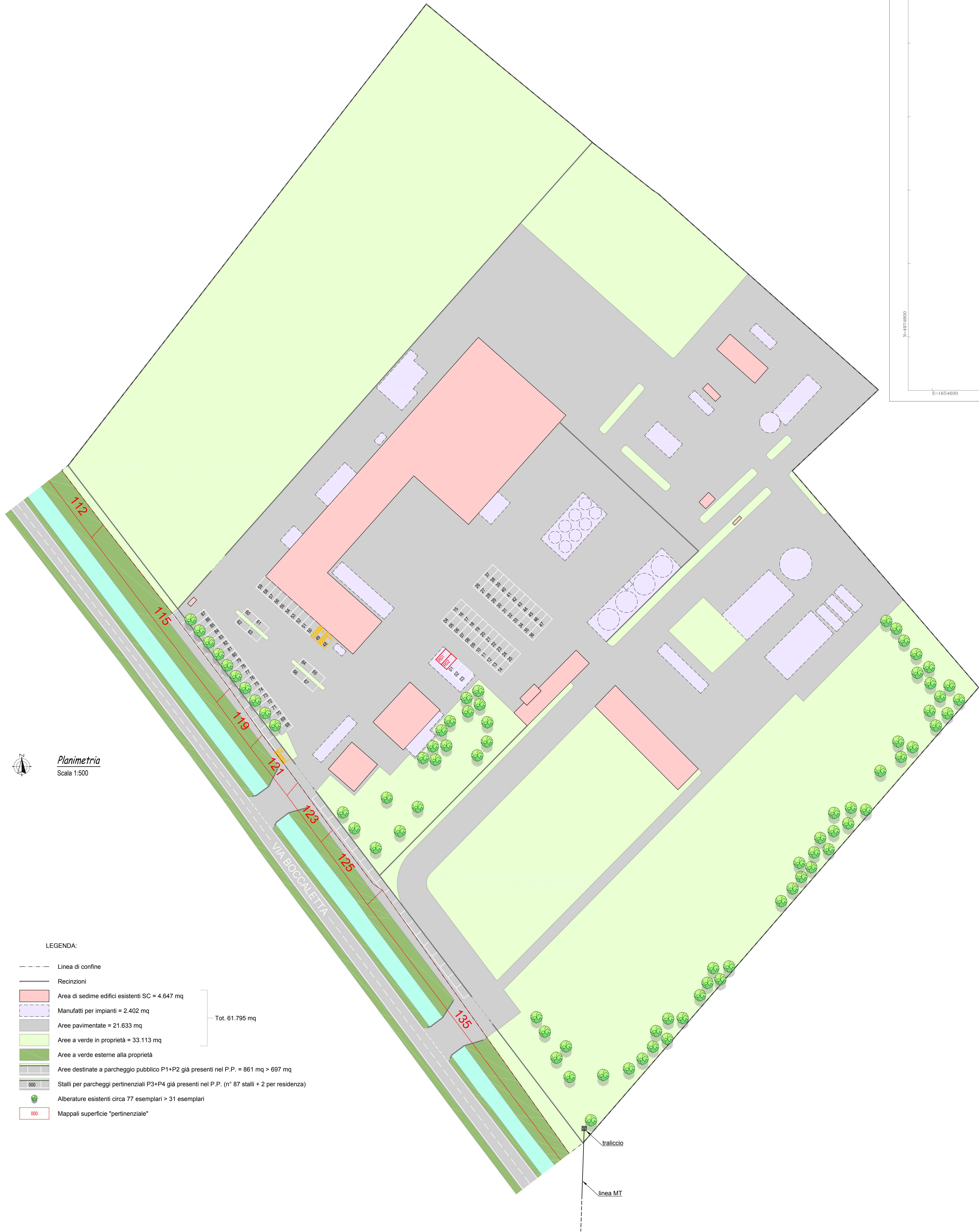
Planimetria Scala 1:500